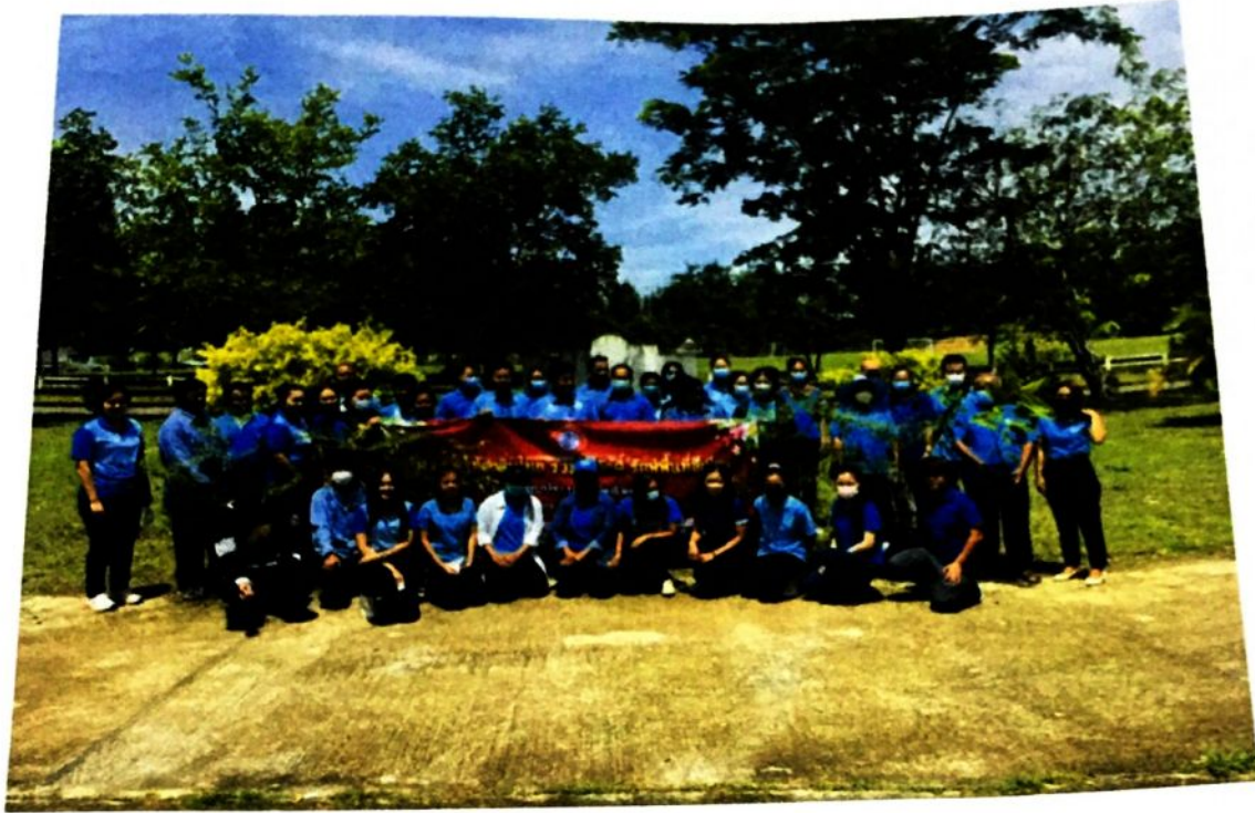
ภาพต้นไม้พร้อมดินปลูกประกอบโครงการท้องถิ่นไทย รวมใจภักดิ์ รักษาพื้นที่สีเขียว ประจำปีงบประมาณ ๒๕๖๕