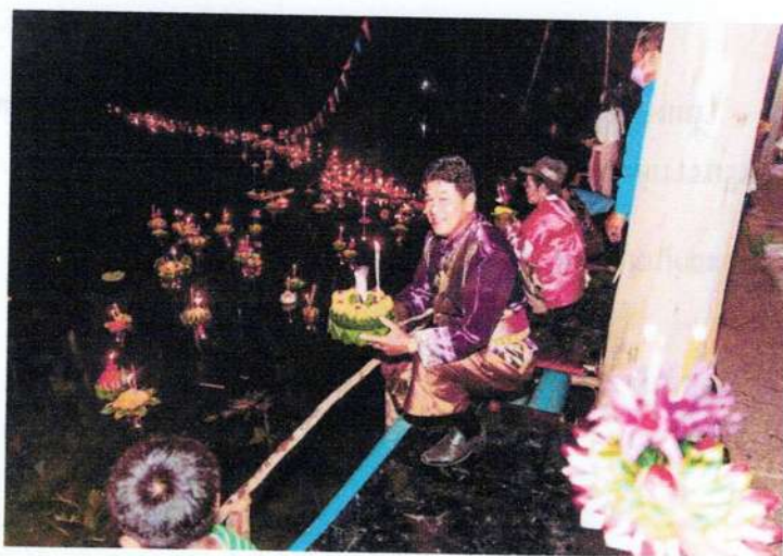
กิจกรรมลอยกระทง