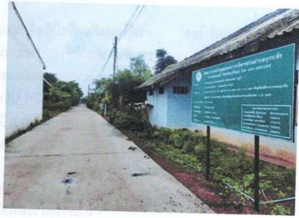
ภาพโครงการก่อสร้างถนนคอนกรีตเสริมเหล็ก บ้านหนองมัน หมู่ที่ 7 (สายศาลาประชาคม ถึงบ้านนายมัน จันทุน) (ต่อหน้าหน้า)