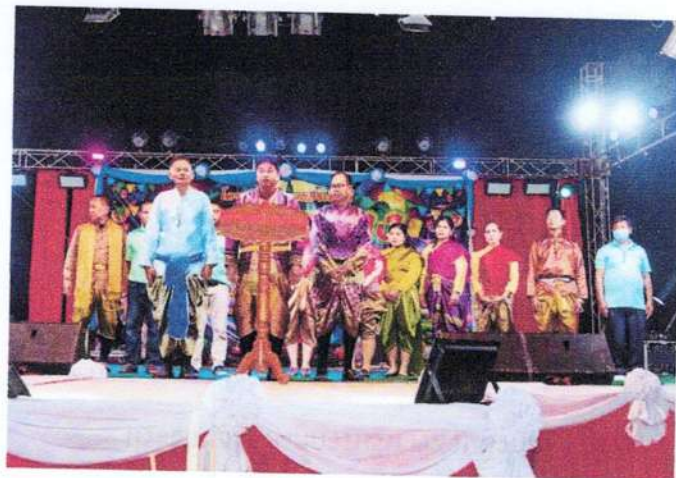
(กิจกรรมการแสดง)