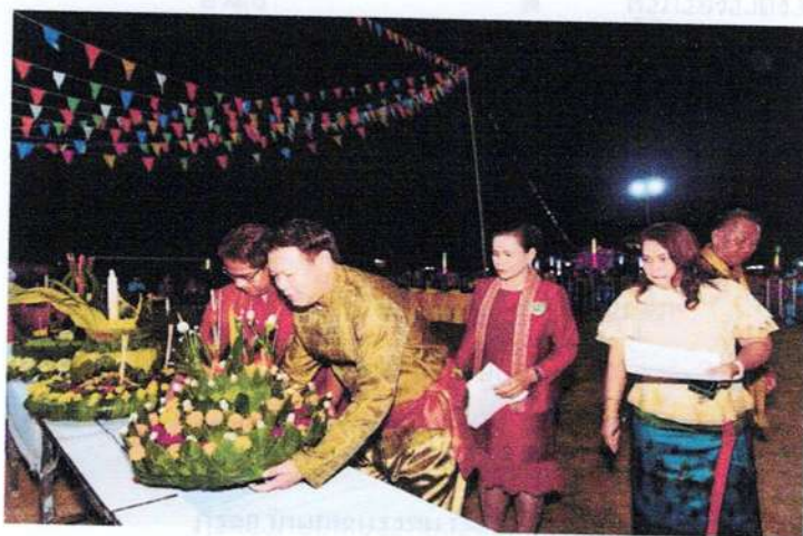
(กิจกรรมจุดเทียน)