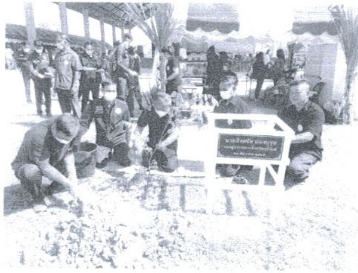
ภาพประกอบโครงการท้องถิ่นไทย รวมใจภักดี รักรักษ์พื้นที่สีเขียว ประจำปีงบประมาณ ๒๕๖๕ องค์การบริหารส่วนตำบลบุกระสัง อำเภอนหนองกี่ จังหวัดบุรีรัมย์